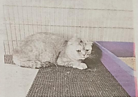
DUA ekor kucing baka Scottish Fold yang dirampas kerana tidak mempunyai Sijil Kesihatan Veterinar dari negara pengeksport di KLIA baru-baru ini.