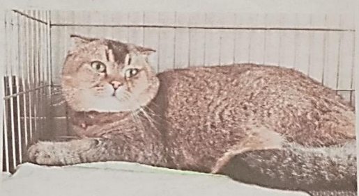
DUA kucing yang dibawa masuk dari Rusia oleh pemilik warga tempatan dirampas.