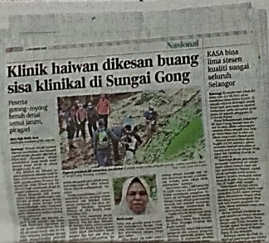
Keratan akhbar BH Ahad semalam.

Awal bulan lalu, 1,292 kawasan di tujuh wilayah sekitar Lembah Klang mengalami gangguan bekalan air berikutan pencemaran Sungai Gong akibat pencemaran minyak dari industri berhampiran sehingga menjejaskan kira-kira lima juta pengguna.