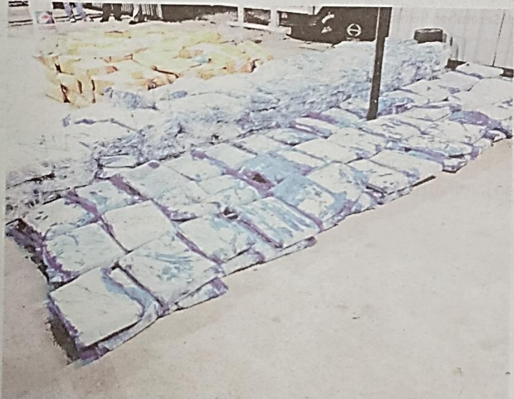
ANTARA bungkusan ayam sejuk beku seludup yang dirampas susulan penahanan sebuah lori di Jalan Lubok Jong, Pasir Mas kelmarin.